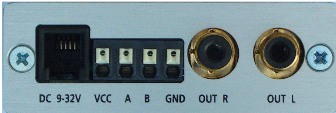
Rückansicht des MM-2200